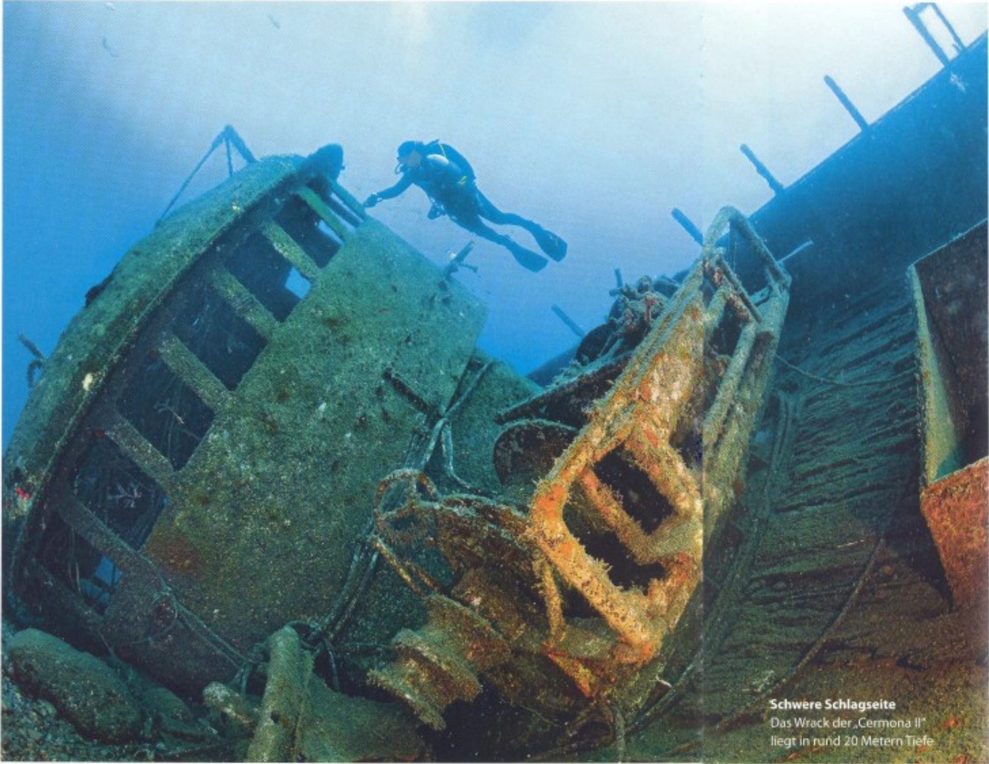
Schwere Schlagseite Das Wrack der „Cermona II“ liegt in rund 20 Metern Tiefe