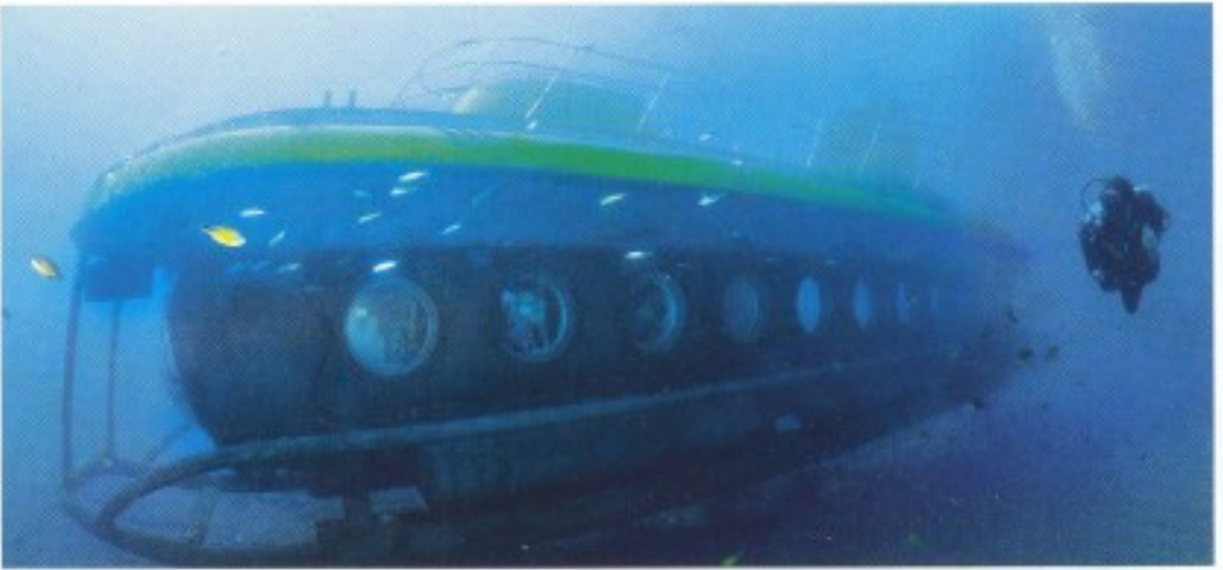
Unter Beobachtung Gäste des U-Boots „Yellow Submarine“ bestaunen einen Taucher im Freiwasser

auch Extra-Divers-Basisleiter Georg Wolf beim Transfer. Mit jedem Kilometer Richtung Westen gibt es weniger architektonische Sünden. Und als wir von der Küstenstraße den ruhigen Atlantik im November unter uns sehen, flachst er: „Das hier ist mein Meer!“ Nach einer kurzen Auszeit hat es den „Schorsch“ nicht mehr in Deutschland gehalten, er musste einfach wieder auf „seine Insel“. Zigtausend Tauchgänge hat der Kerl in seinen Waden – gut für die Extra Divers! Ihre neue Tauchbasis ist in der noblen Anlage des Viersterne-Plus-Hotels Cordial Mogán Playa im „Blauen Haus“, auch Taucherhaus genannt, integriert. Übrigens: Egal wo man wohnt, jeder Spaziergang, ob zur Basis, zum Restaurant, zur Bar oder den vielen Freizeiteinrichtungen, wird zum erholsamen Vergnügen. Denn er führt durch eine herrlich angelegte Anlage mit über 220 verschiedenen Pflanzen.