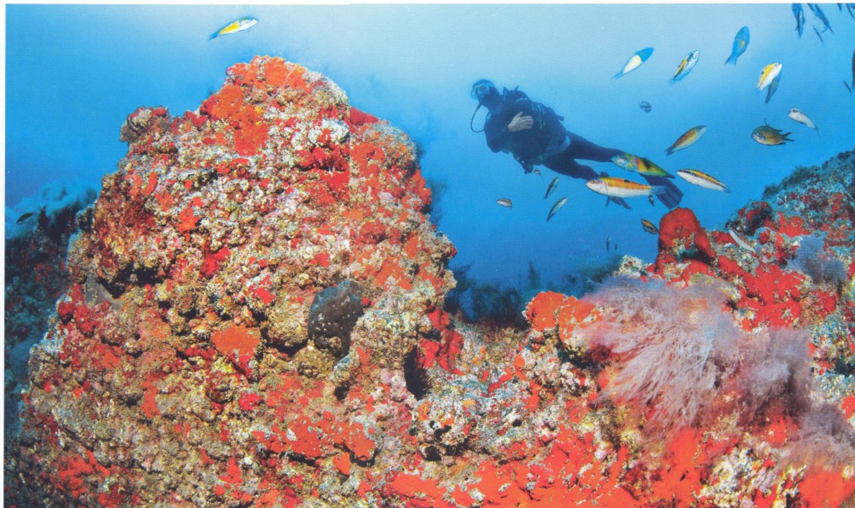
Schön bewachsen Vulkanfelsen mit Schwämmen. Ein See- pferdchen auf einem Fischernetz (links)