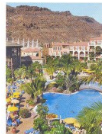
Oase der Ruhe Blick auf das Hotel Cordial Mogán Playa und seine mit Palmen besetzte Poolanlage