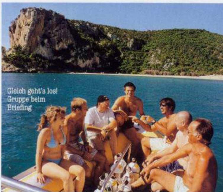
Gleich geht's los! Gruppe beim Briefing