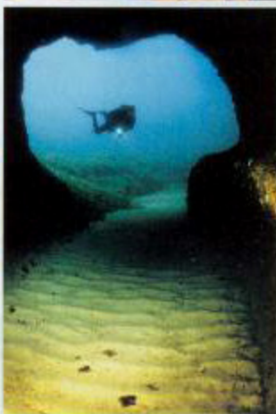
Sardische Grotten stehen für intensive Türkis-Kontraste