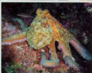
Höhlenbaumeister: der Gewöhnliche Krake