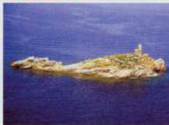
Meerumschlungen: die Insel Scoglietto im Naturschutzgebiet