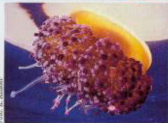
Unverwechselbar: Die Spiegelei- Qualle ist die bunteste in Europa